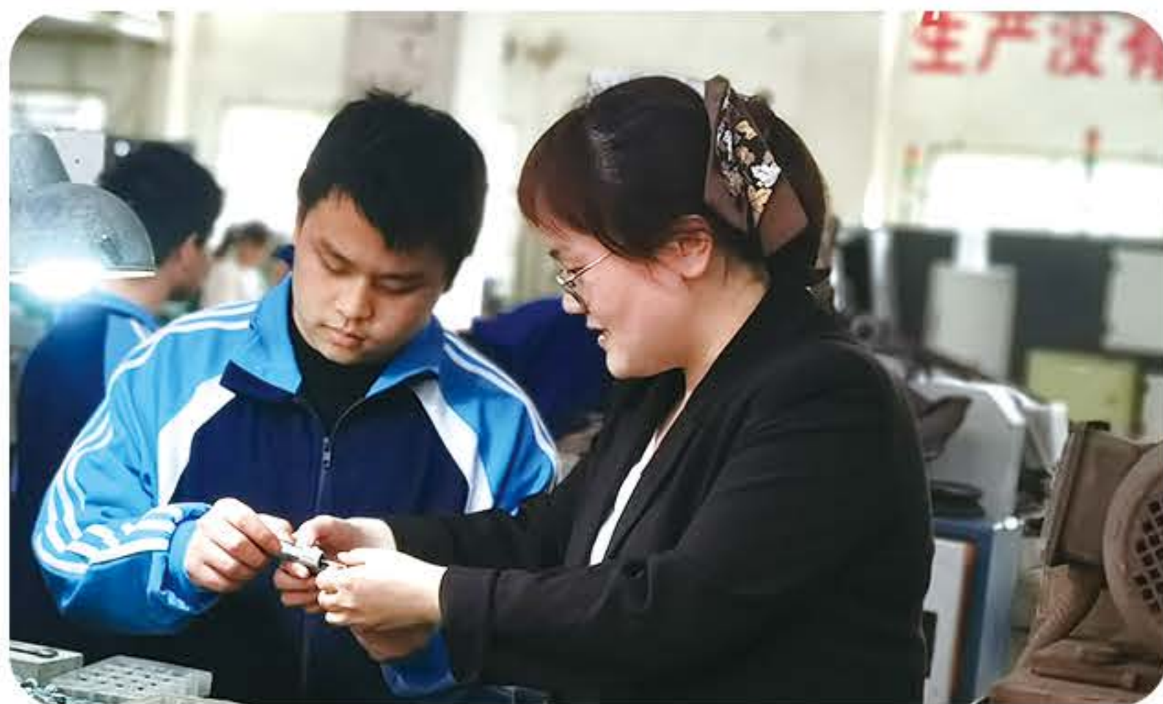
(机电专业学生实训)