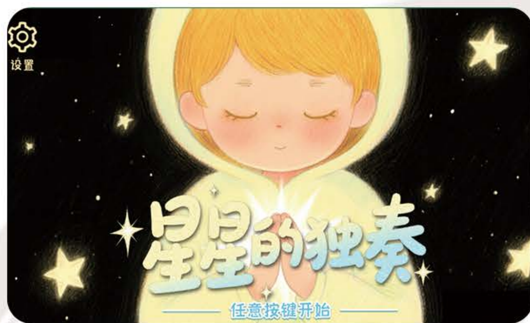
(学生交互设计作品)