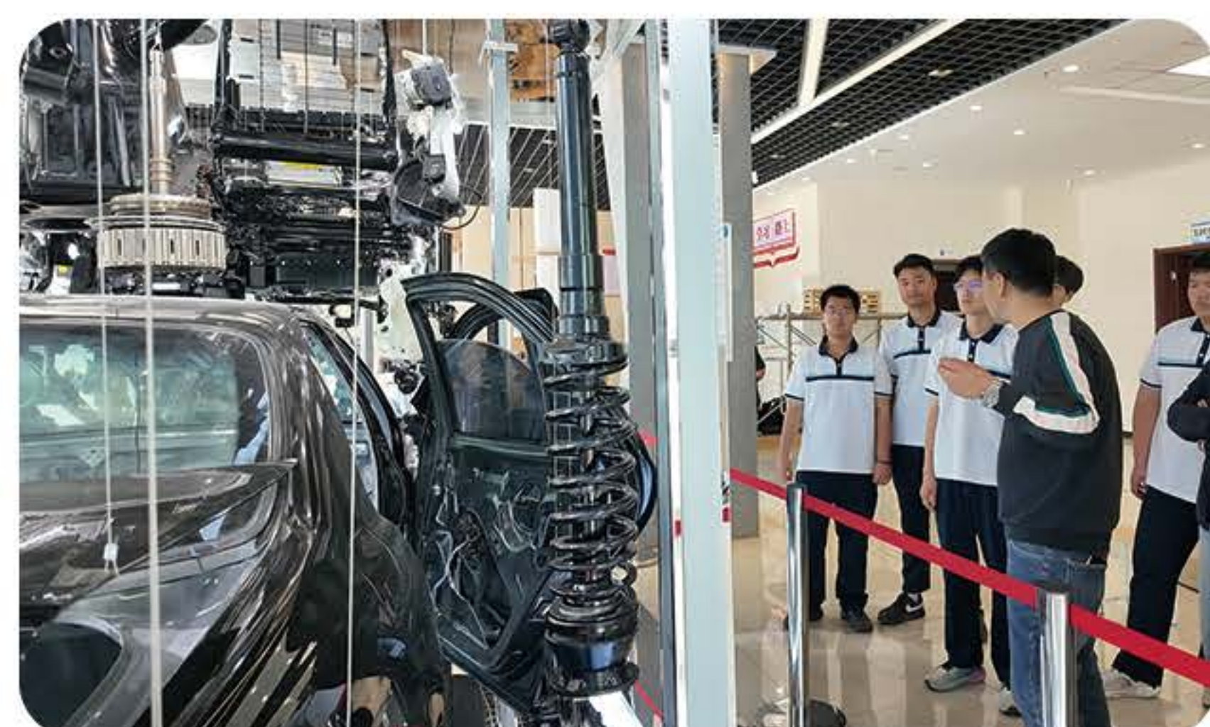
(新能源汽车专业实训室)