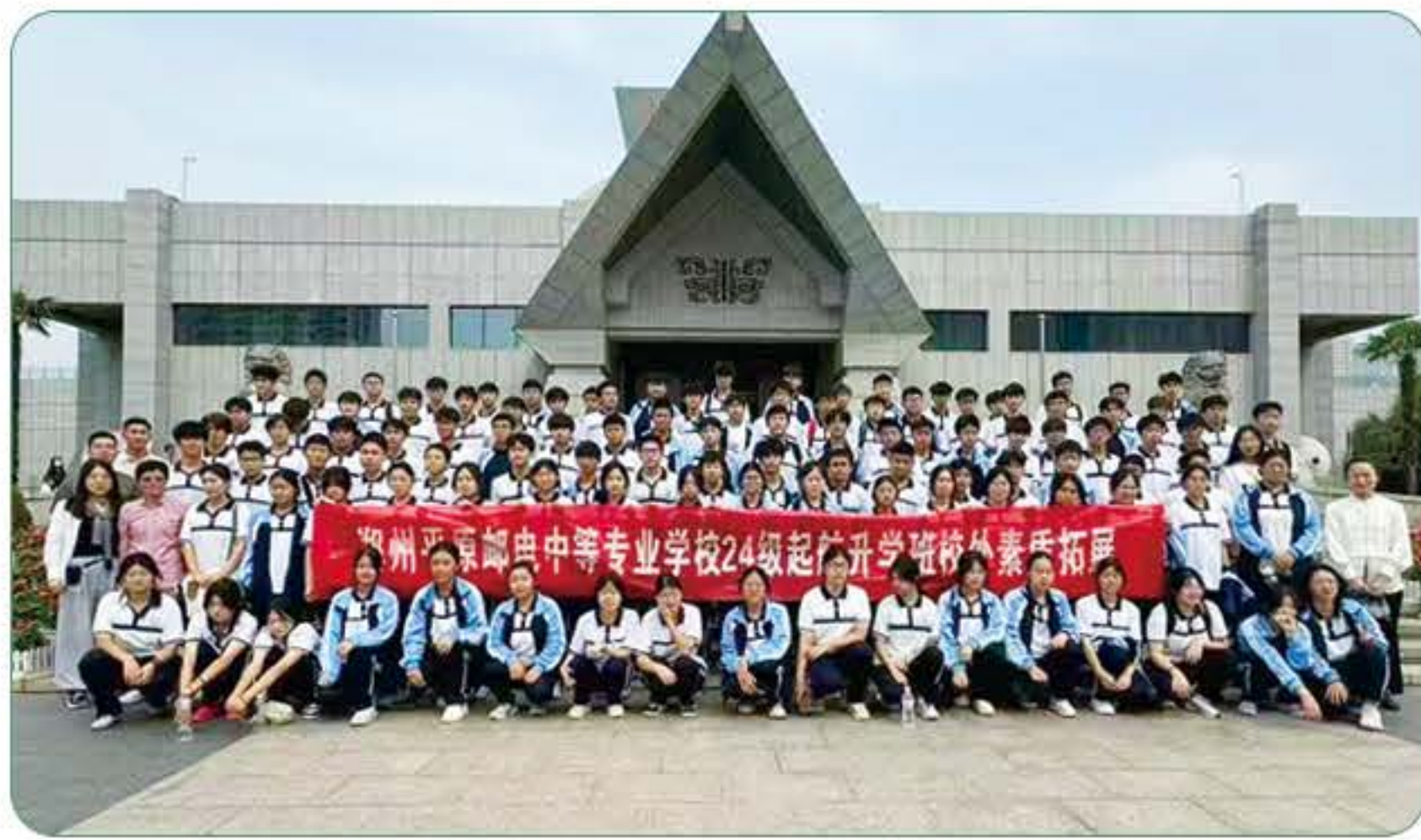
(学生户外拓展训练)