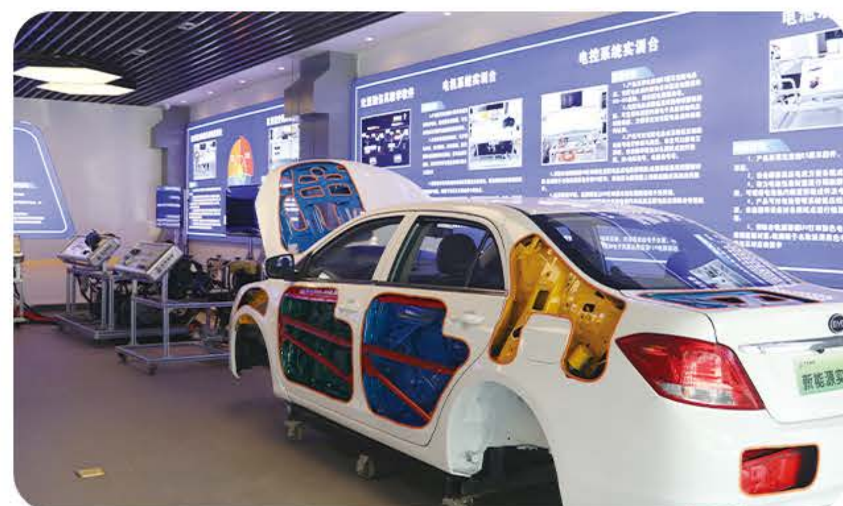
(新能源汽车专业实训)