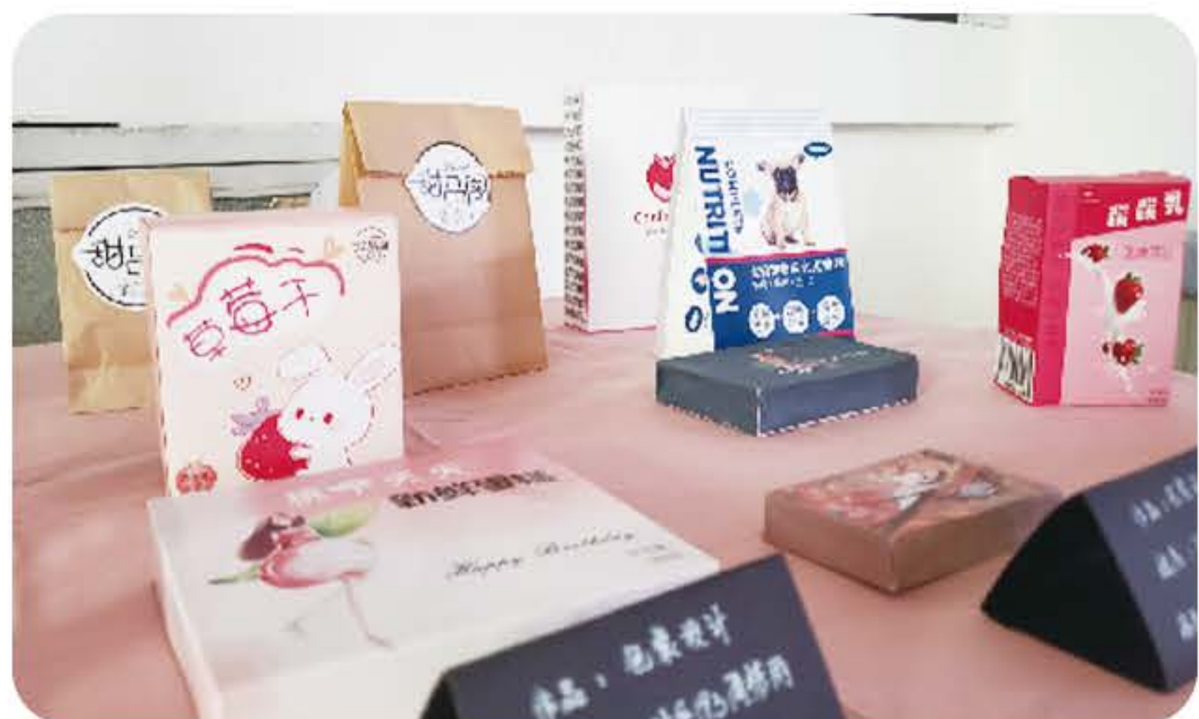
(学生包装设计作品)

就业方向： 可在艺术设计部门、城市环境规划部门、广告公司、包装印刷、IT行业、新闻媒体、学校等单位从事视觉传达设计、室内外展览展示设计、广告艺术设计、网络媒体艺术设计等工作。