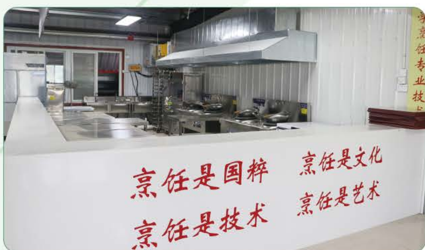
(中餐烹饪专业实训室)