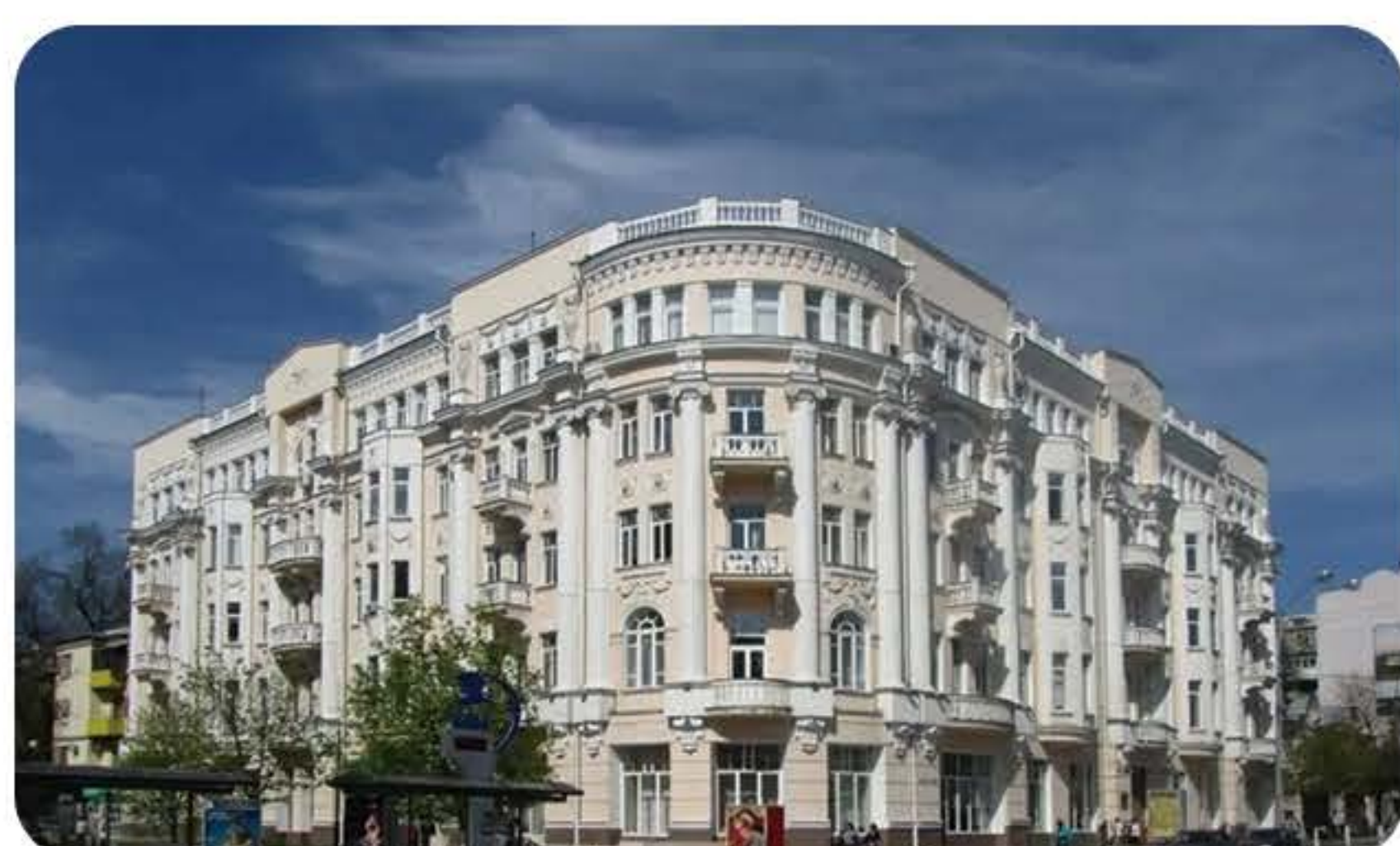
(南联邦大学教学楼)