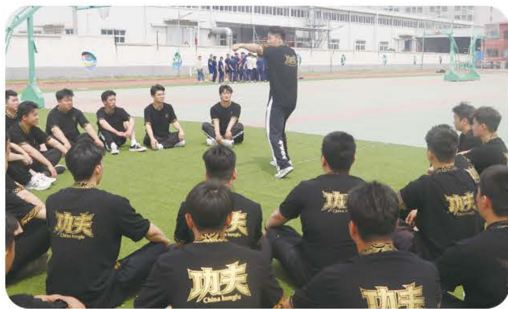
(武术专业讲解套路拳法)