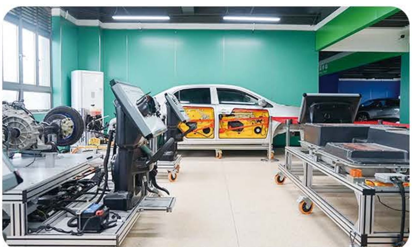
(新能源汽车实训室)