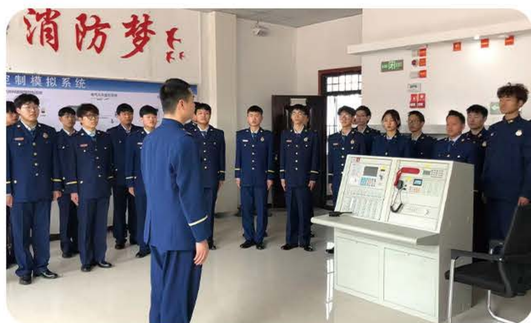
(应急救援专业教学)