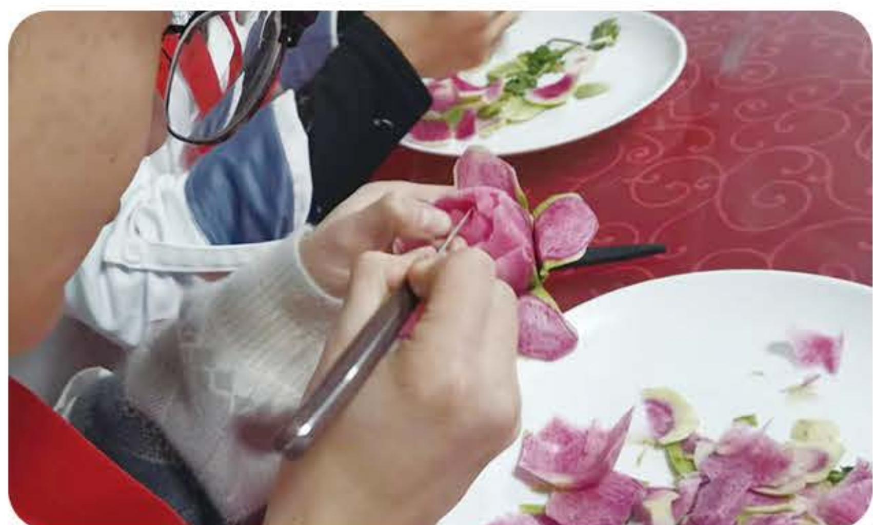
(烹饪专业学生雕刻训练)

就业方向： 面向高星级饭店、餐饮连锁企业等就业，从事烹调、面点制作、后厨管理、宴会设计与制作餐饮企业运营与管理等工作。我校一批优秀毕业生在各星级酒店任职。