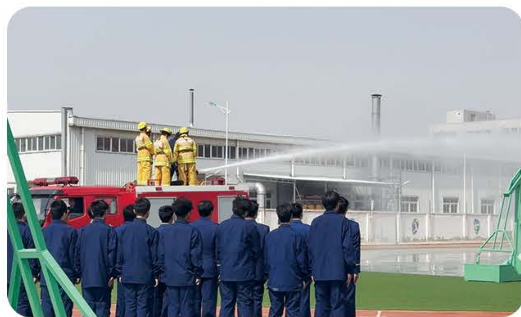
(应急救援专业实训)