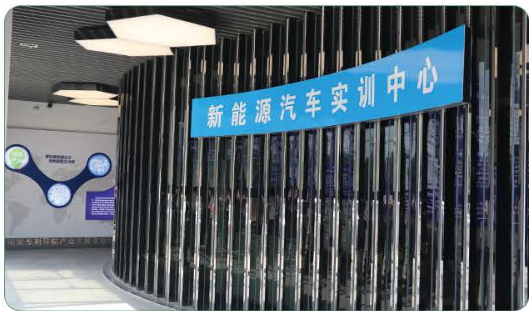
(新能源专业实训室)