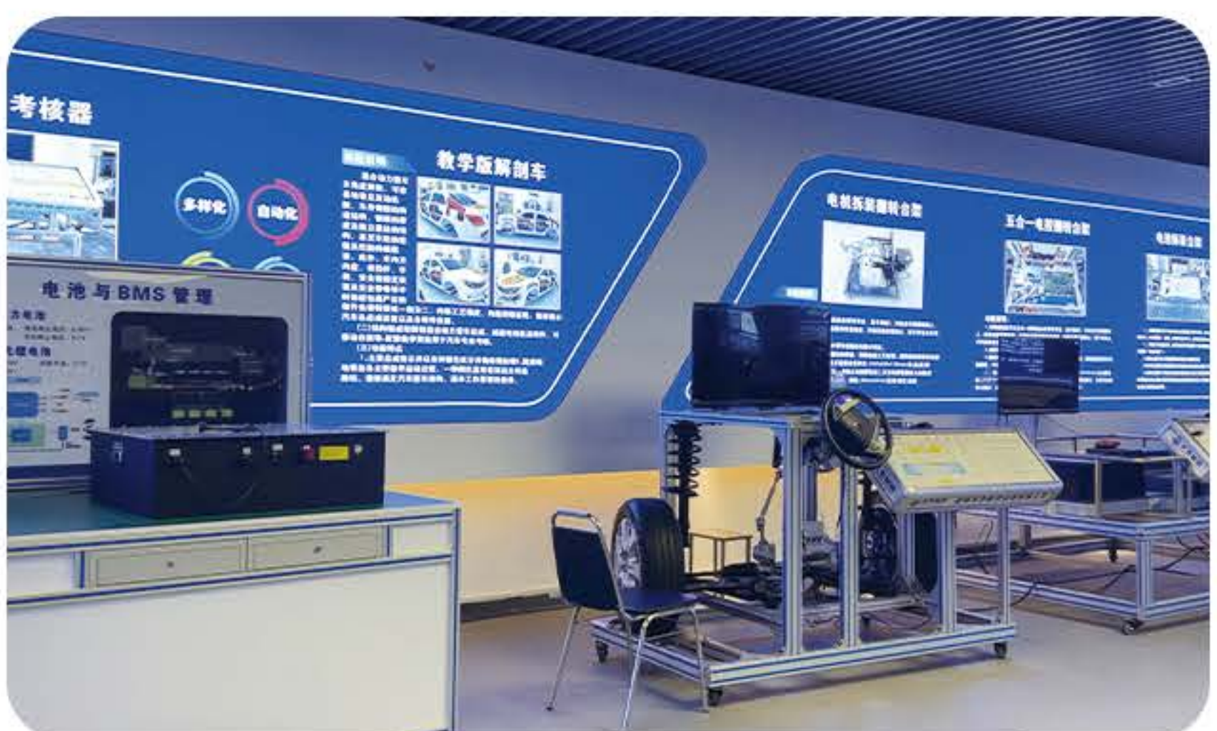
(新能源汽车实训室)

就业方向： 主要面向汽车维修企业、汽车品牌4S店、汽车特约维修站、汽车检测机构等单位，在汽车市场的技术服务，从事汽车的汽车检验与检测、汽车机电维修、维修管理和车辆技术管理等相关工作。