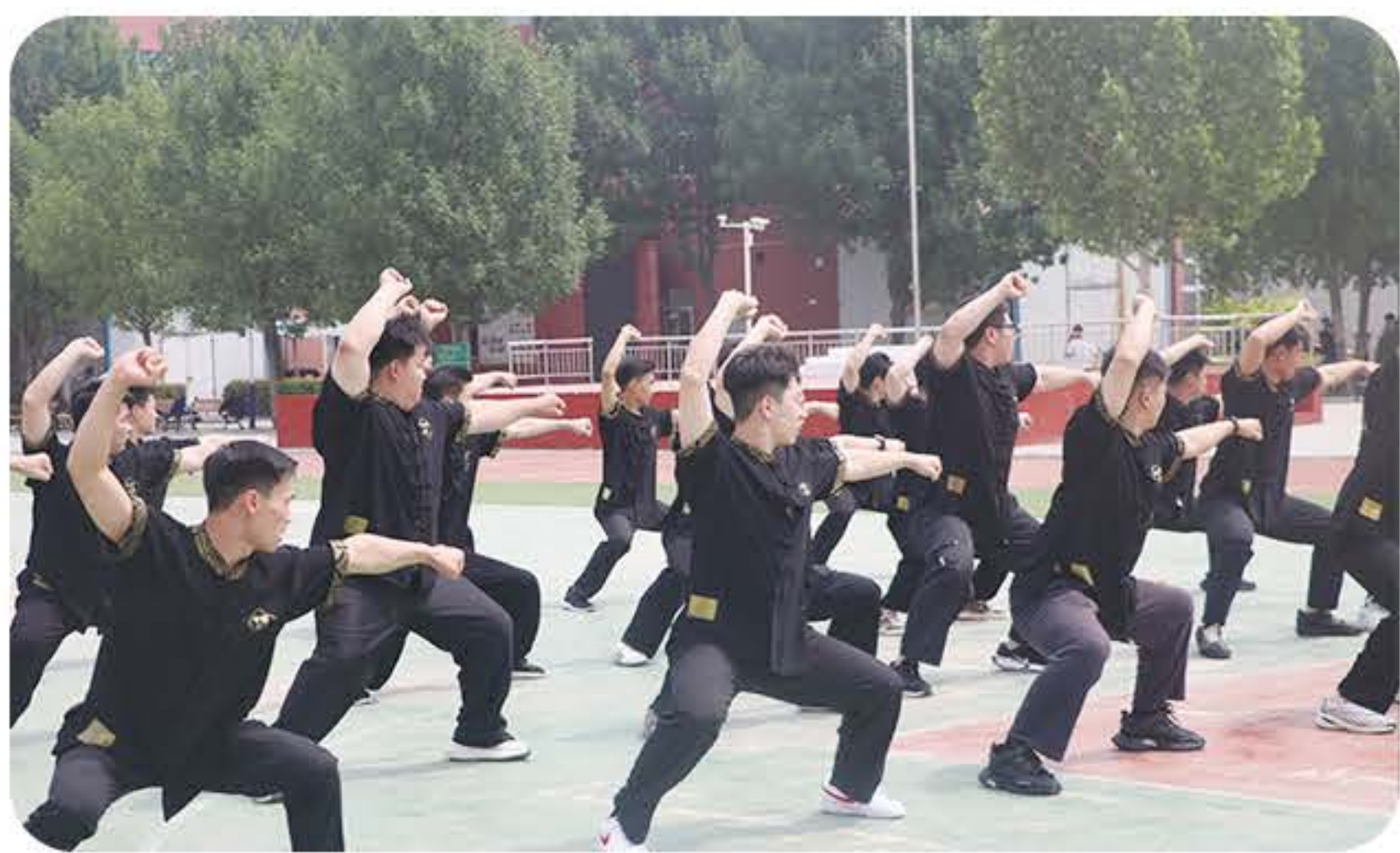
(武术专业操场实训)

就业方向： 主要面向事业单位、警队或特殊军事人才、政府体育行政人员、自媒体博主、中小学体育老师、武术裁判员、武术指导、武术专业人员、体考培训等。