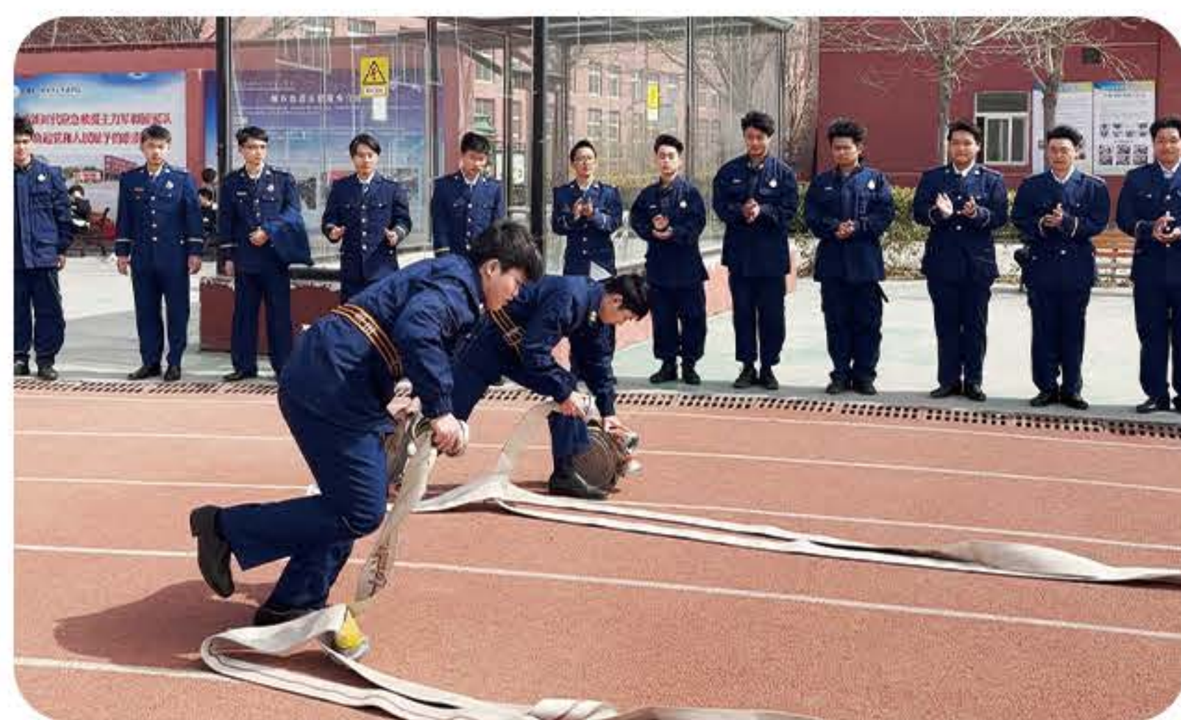
(应急救援现场实训)

就业方向： 参军入伍、政府专职消防队、民航系统等，消防技术与工程研究和开发部门，应急救援部门、地方消防行政管理部门和消防检测机构，大中型企业单位消防事务管理，各大型企业、机场、港口、重要物资的大型仓库等专职消防队，以及城市社区消防安全管理等工作，就业前景广阔。