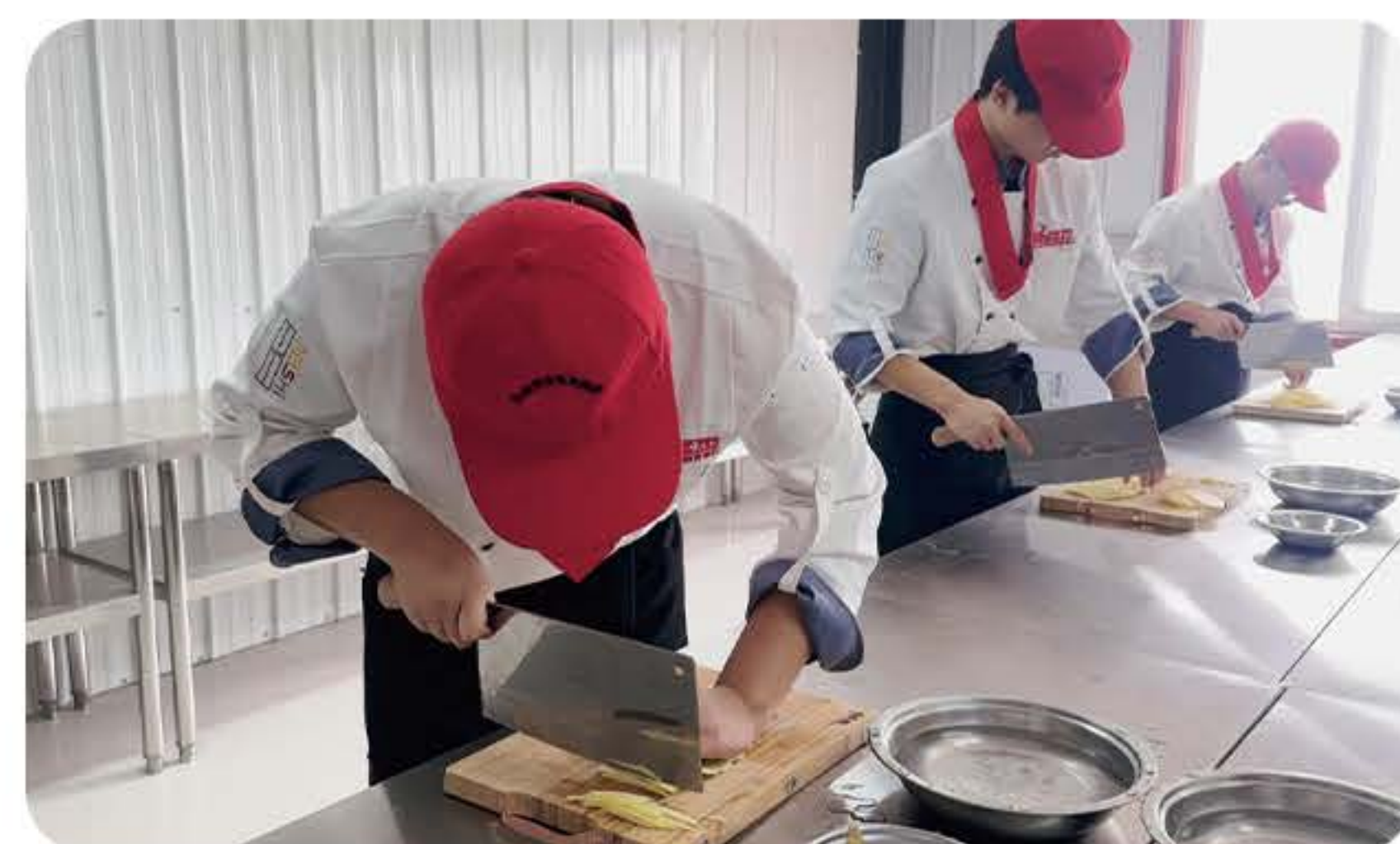
(烹饪专业学生-刀工课)