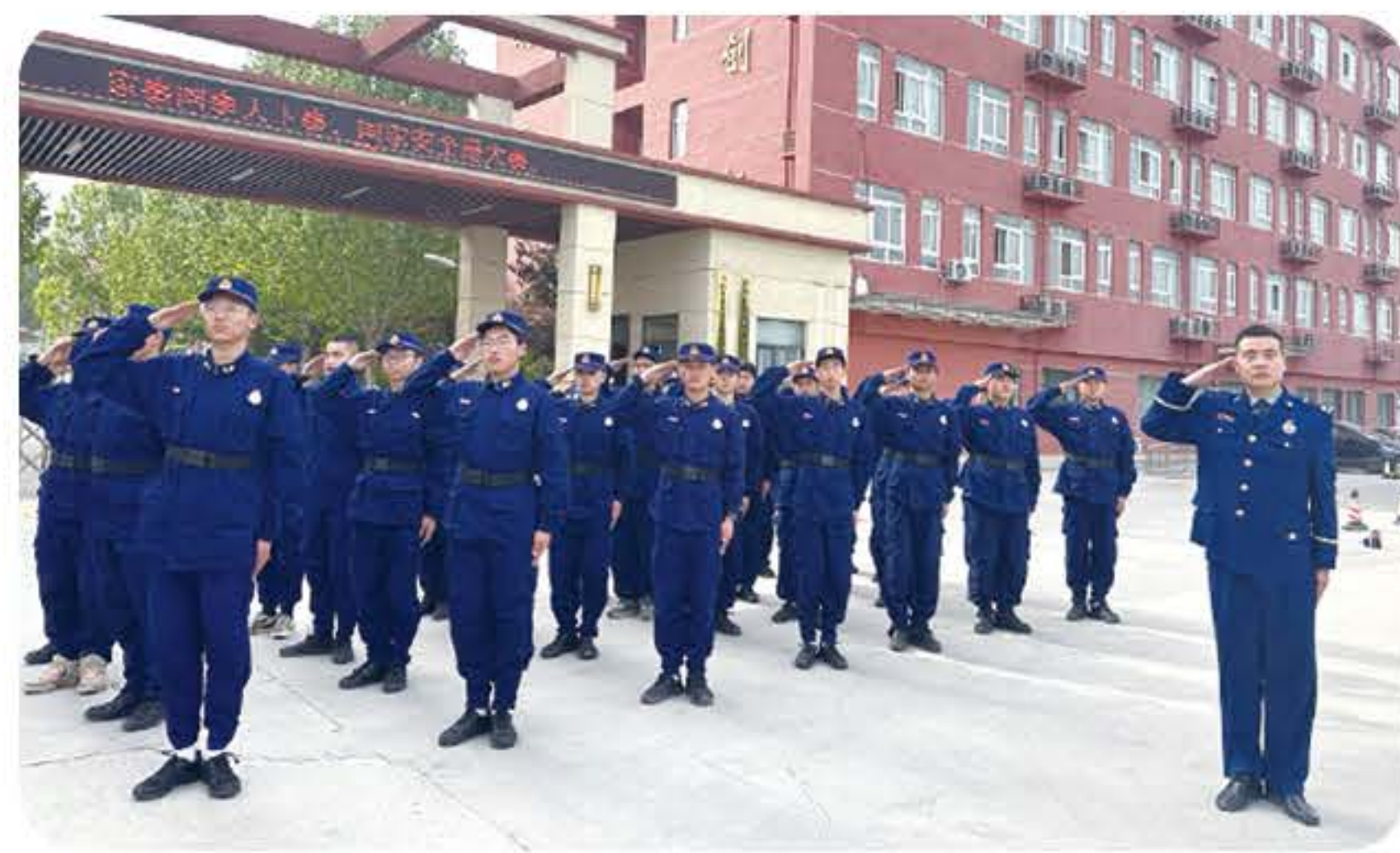
(应急救援专业实训)