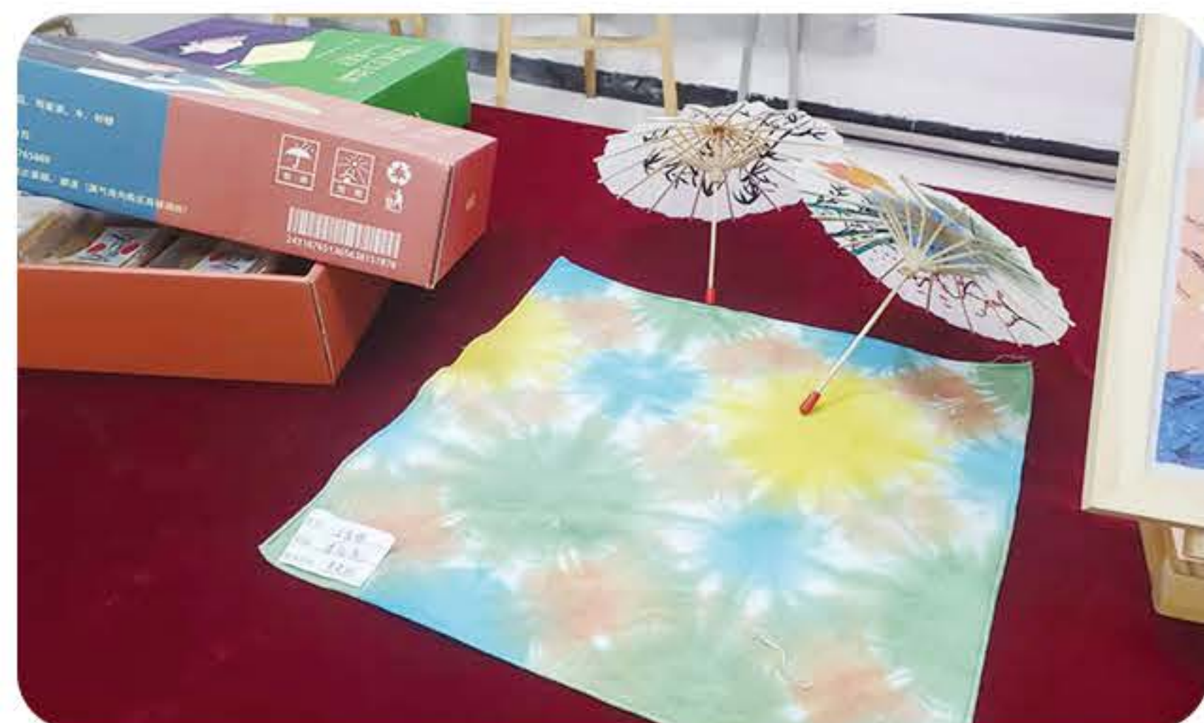
(平面学生设计作品)