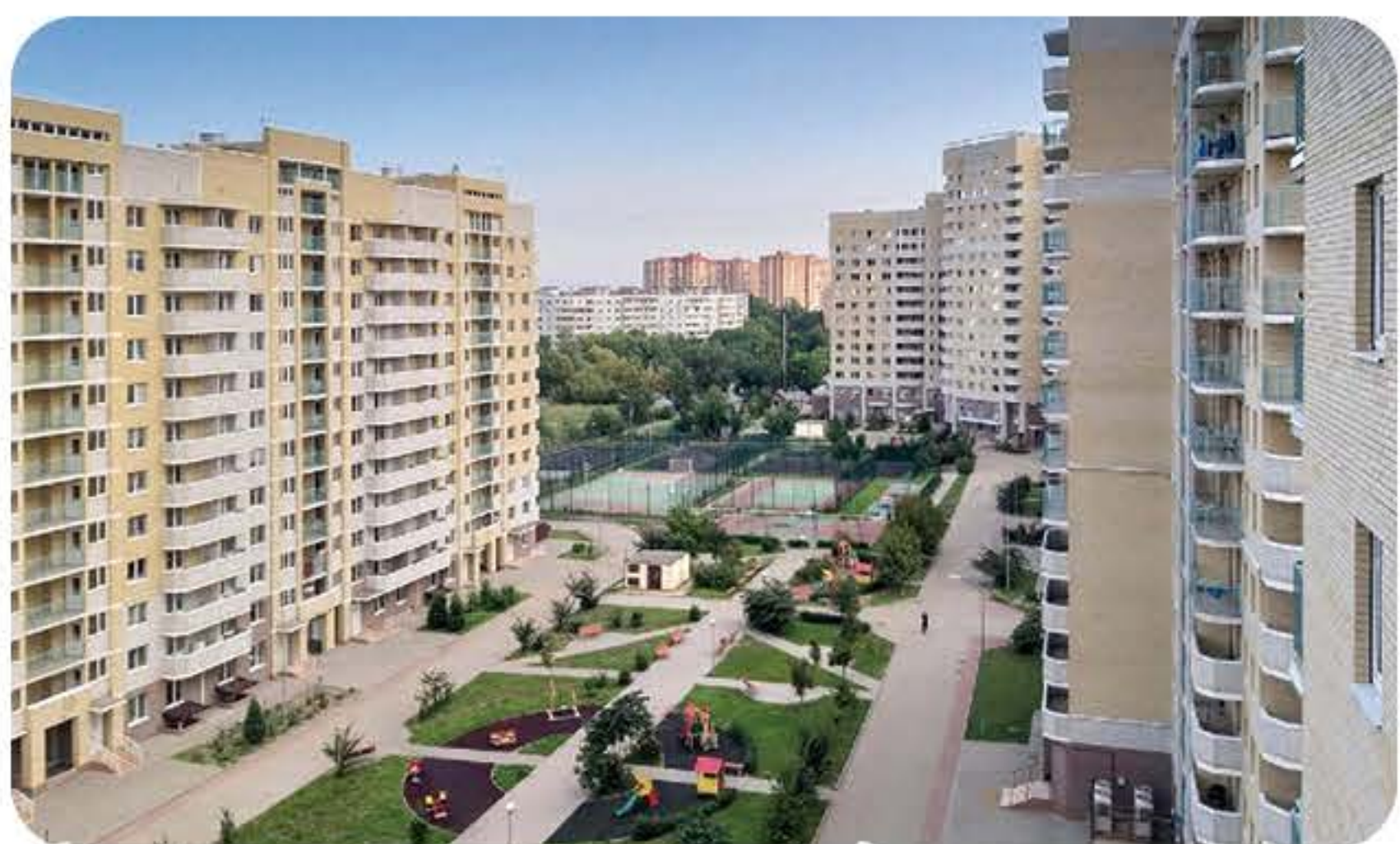
(南联邦大学学生宿舍环境)

学校排名： 在俄罗斯大学中位列第17-23名，2024年QS排名：位于701-710区间，与中国石油大学（北京）和苏州大学排名相近。